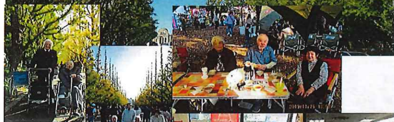
今年の銀杏は青かった～

令和元年初の外出レクは4ヶ所！ ◎新宿は歌舞伎町のゴジラカフェ ◎和食レストラン「かごの屋」 ◎コルモビアでお買い物 ◎神宮外苑銀杏並木 みんな笑顔で楽しんでます。