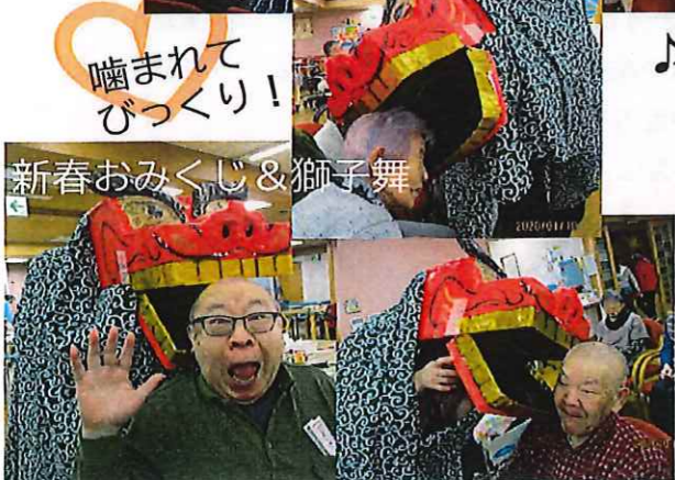
噛まれてびっくり！ 新春おみくじ&獅子舞