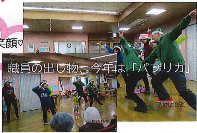
職員の出じ物、今年は「パプリカ」