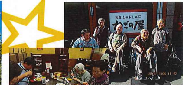
皆で食べるとおいしいね