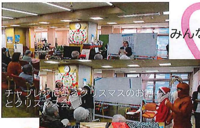
チャプレンによるクリスマスのお話とクリスマス会